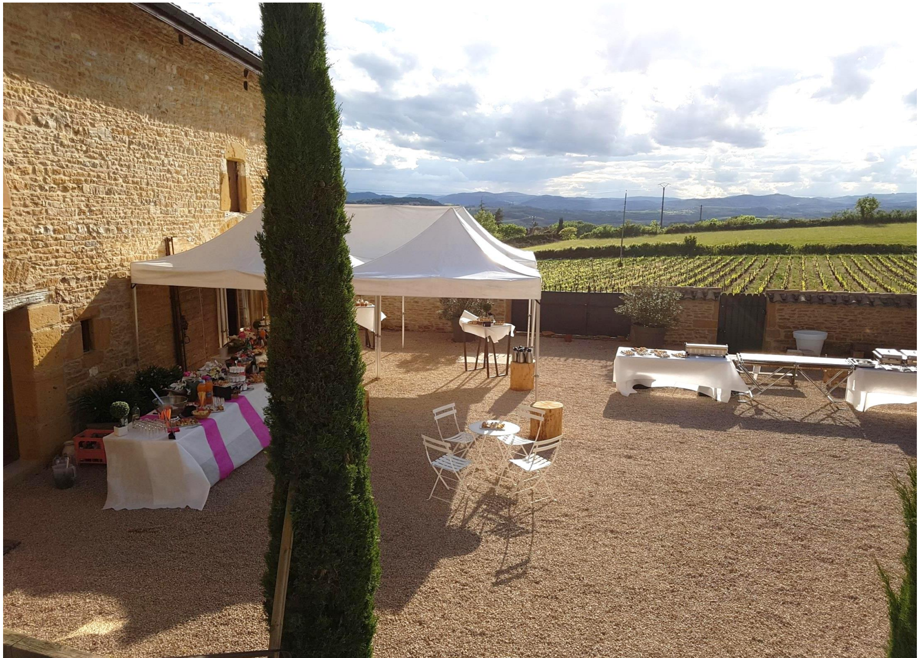
Domaine La Cour dorée - 69380 Charnay - 06 82 14 00 52