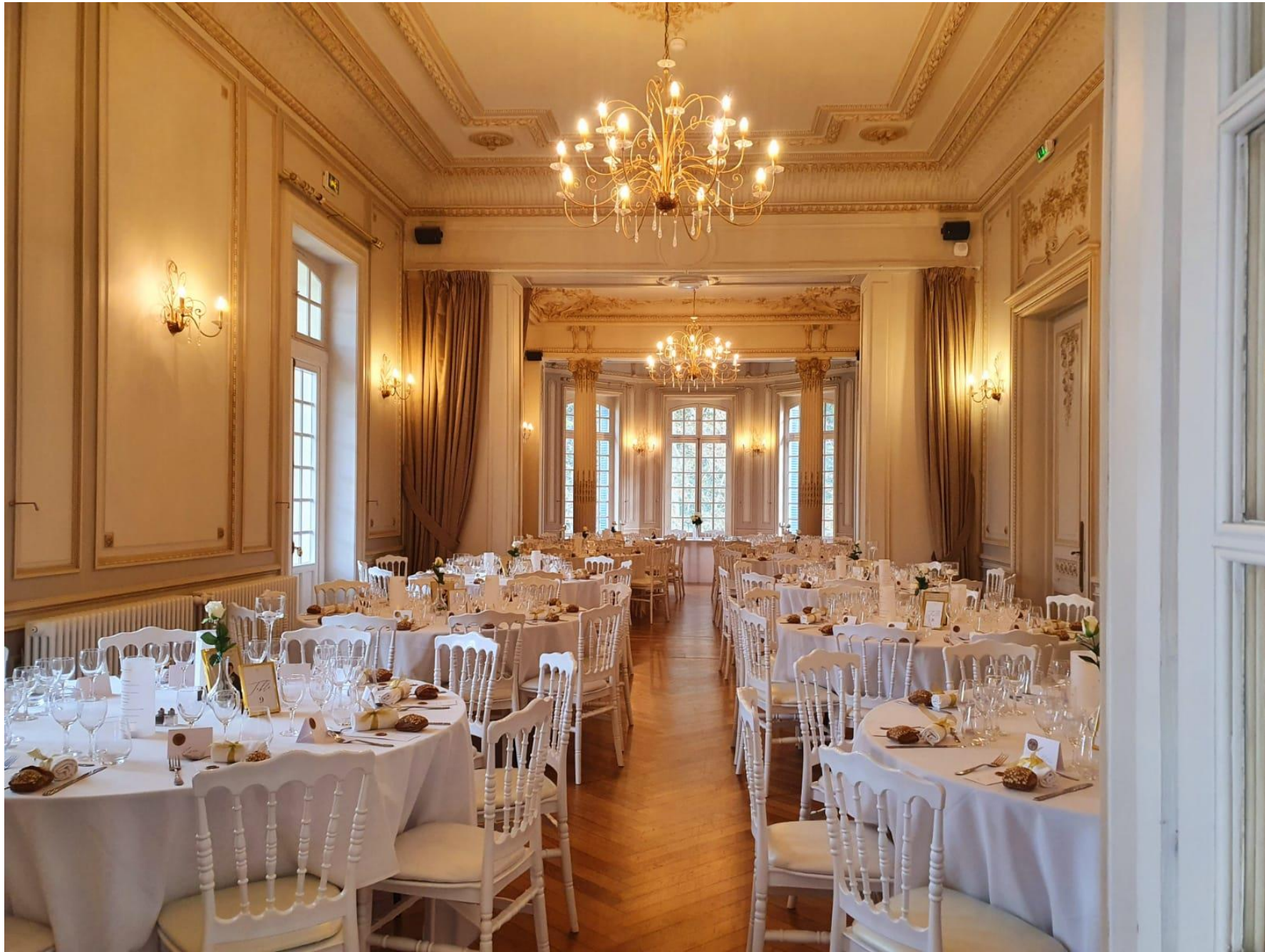
Château de Rajat – St Pierre de Chandieu - 04 72 54 33 43